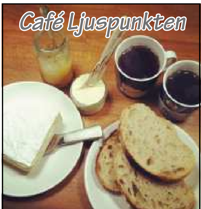
Hallundakyrkan Torsdagar 10.00-12.00