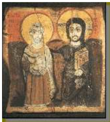
Vänskapsikonen från 600-talet föreställande abboten Minas från Egypten och Jesus. Originalen finns i Louvren, Paris. En kopia finns också i kyrksalen i Hallundakyrkan vilken är köpt i Taizé.

Jesus inbjuder oss att vara hans vänner. Det är stort att få vara någons vän. Att vara Jesu vän är störst.