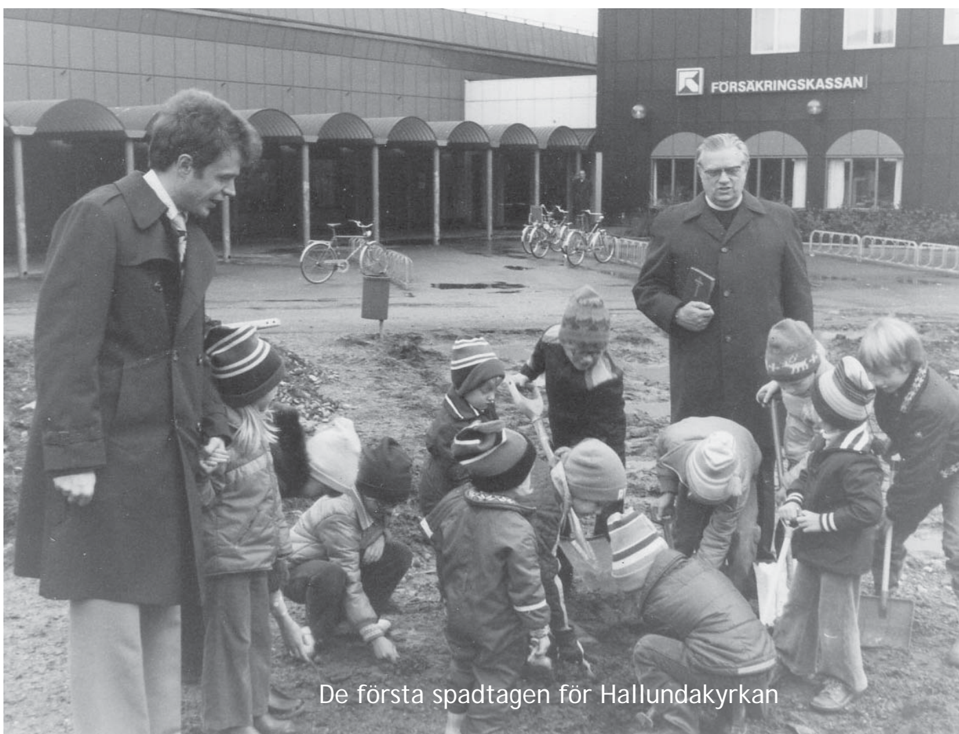
De första spadtagen för Hallundakyrkan

Café Ljuspunkten torsdagar 10.00 - 12.00