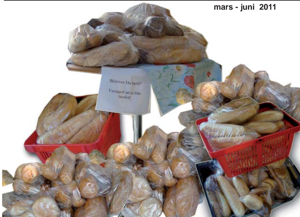
Hallundakyrkans bröd till behövande