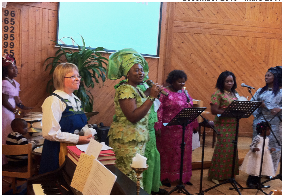
Gudstjänst i den engelsktalande församlingen den 24 okt med Womens Fellowship Worship in October 24 with the Womens Fellowship

Please remember the annual meeting after service Sunday, February 6 Kom ihåg årsmötet efter gudstjänsten den 6 februari