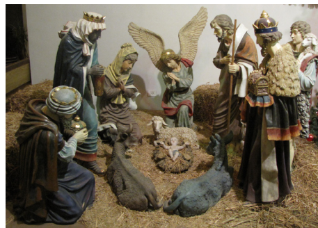
The Christmas Crib in Peace Center, close to the Nativity Church in Bethlehem

A very Merry Christmas and a hope-filled New Year to you all! I love you!